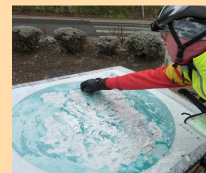
Pas besoin de GPS