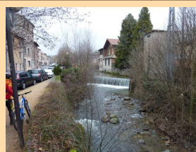
L'Ardières à Beaujeu