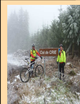
Le col de Crie