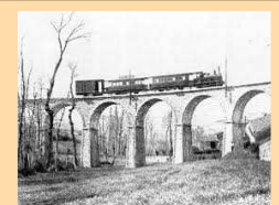
Viaduc de Salles Arbuissonnas