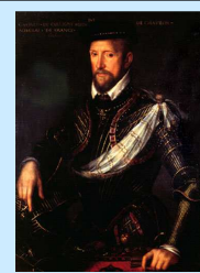
Amiral de Coligny