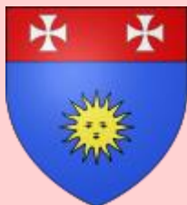
Blason de Fontaines Saint Martin

Ces origines sont rappelées par de nombreuses croix de Savoie dans l'église et sur le blason municipal.