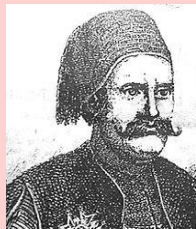
Soliman Pacha (Lyon 11/5/1788 – Le Caire 11/3/1860)

Il s'expatrie et débarque en Egypte en juillet 1819. Il se met au service du Sultan Méhémet Ali. 2 ans plus tard il est colonel dans l'armée égyptienne et il se convertit à l'Islam sous le nom de Soliman. Les promotions à l'intérieur de l'armée se suivent rapidement. Après bien des combats qui l'emmèneront en Grèce où il sera à nouveau blessé et à Jérusalem, il sera nommé généralissime et élevé à la dignité de Pacha en 1833. Il mourra comblé d'honneur au Caire le 11 mars 1860.